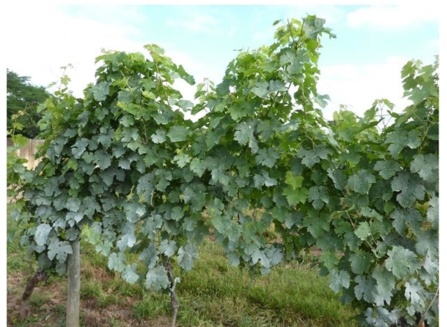
Feuillage après traitement à la Kaolinite calcinée

Avantage → L'application peut se faire en même temps que vos traitements, pas besoin de passage supplémentaire !