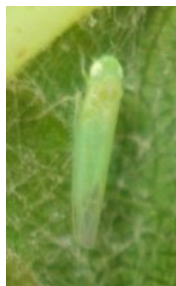
Cicadelle verte adulte

Dégâts : La G2 est la génération qui cause le plus de dégâts sur la vigne :