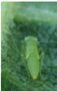
Larve de cicadelle Verte

→ fin juillet : troisième génération (G3)