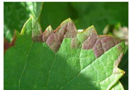
Symptômes de grillures sur feuille

Ces grillures peuvent entraîner une diminution de l'activité photosynthétique, un retard de maturité et une diminution de la teneur en sucre.